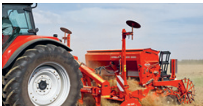
Neue «Seedflex» Doppelscheibenschar bei den «Sitera» Sämaschinen.