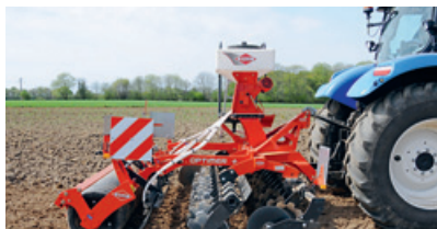
Kurzscheibeneggen «Optimer Serie 103+» mit mehr Durchgang.

Mit über 1500 Patenten gehört Kuhn zu den innovativen Herstellern von Landtechnik. Das Unternehmen ist nach diversen Zukäufen in den letzten Jahren heute breit aufgestellt und kann in den Produktgruppen Pflügen, Bodenbearbeitung, Saat, Düngung, Miststreuen, Pflanzenschutz, Mulchen und Landschaftspflege, Futterernte, Pressen und Wickeln sowie Fütterungstechnik heute ein umfangreiches Sortiment bieten. «Mit der Hilfe von Landwirten entwickeln wir Lösungen von morgen», heisst es bei Kuhn. Nebenstehend ist eine Auswahl von Neuheiten des Jahres 2011 aufgeführt. ■