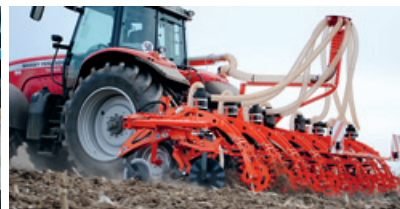
«Striger», ein neues Konzept, das nur in der Säreihe den Boden bearbeitet.