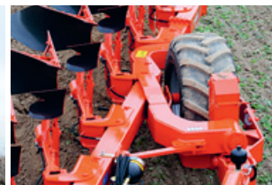
Wendigere «Multi-Leader» Aufsattelpflüge.