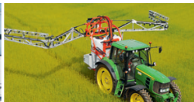
Neues, dreidimensionales Spritzgestänge «Mea-3».