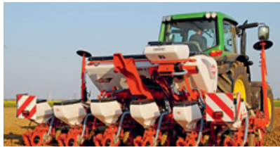
Einzelkornsäegeräte «Planter» mit einfacheren Einstellmöglichkeiten.