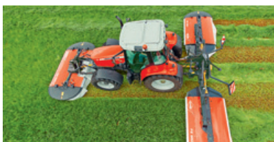
Neuer Schmetterling-Trommelmäher «PZ 960» als Upgrade des «PZ 900».