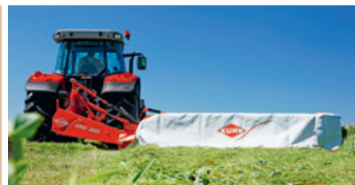
Scheibenmäher «GMD 350» mit vertikaler Einklappung.