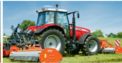
Mulcher «BP 8300» mit hydro-pneumatischer Entlastung.