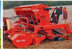
«Integra 3003»: Neue Aufdrillmaschine.