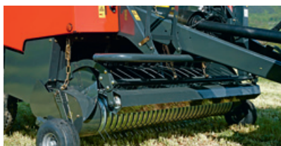
Rundballenpressen: Einzugsystem mit hydraulisch absenkbarem Förderkanal.