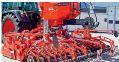
Pneumatische, klappbare Säkombination «Venta NCR 4500».