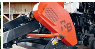
Vorbauhäcksler zur Quaderballenpresse «LSB» stammt von Remund&Berger.

In loser Folge publiziert die UFA-Revue unter dem Titel «Bilderbogen» illustrierte Berichte über landwirtschaftliche Maschinen – in enger Zusammenarbeit mit den entsprechenden Herstellern oder Importeuren. Mehr zu den vorgestellten Kuhn-Produkten erfahren Sie unter www.kuhncenter-schweiz.ch